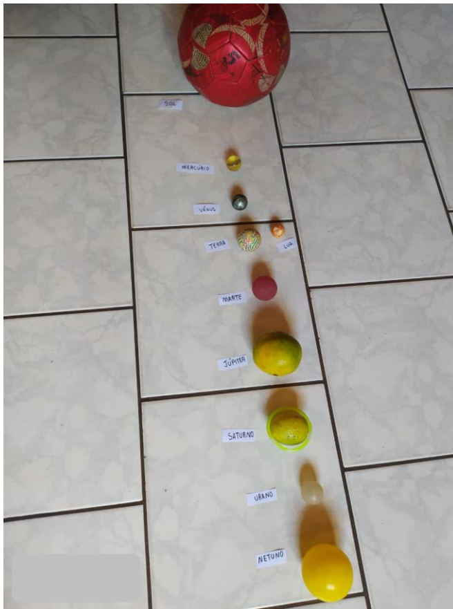
Sistema solar feito pela professora na quarentena.