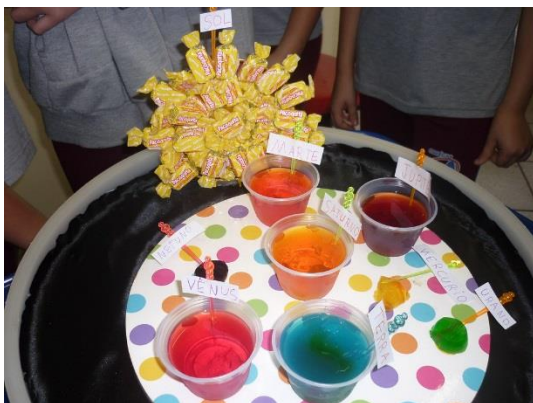
Sistema solar comestível.

2) Observe o desenho da página 258 do livro 1 e faça com a ajuda da sua família uma maquete criativa. No vídeo o pai de Jet fez uma maquete usando o jantar, use o que você tem em casa, pratos, copos, bolinha de papel, brinquedos. Seja criativo, abaixo tem algumas imagens para você se inspirar. Depois tire uma foto e cole no caderno.