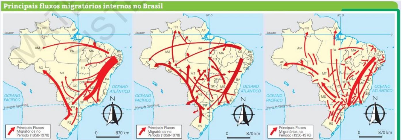
c) Imagem 3.