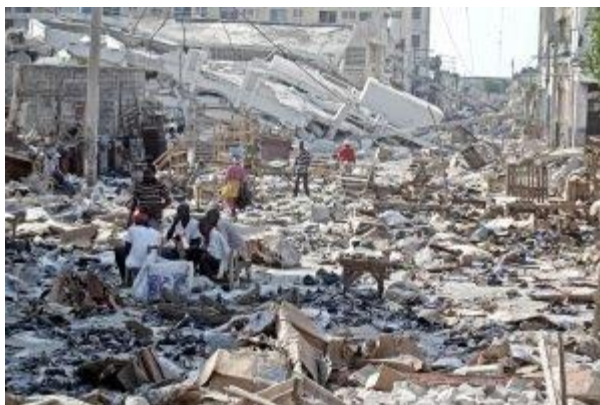
Figura 3: Estragos do terremoto de 2010 no Haiti.