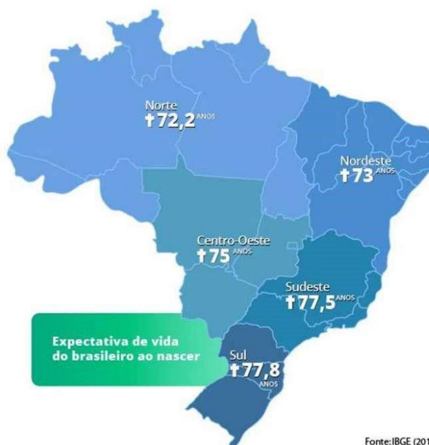
Figura 1: Mapa de expectativa de vida dos brasileiros por região.

Dinâmica populacional de determinado país, diz respeito a variação das estatísticas populacionais, ou seja, na quantidade de habitantes. E, como você já sabe, população é um conceito utilizado para designar o conjunto de habitantes de determinado território. E, cada território apresenta uma dinâmica e estrutura da população brasileira que varia de acordo com o conjunto de características socioeconômicas e históricas. Vamos juntos revisar a dinâmica e estrutura da população brasileira?