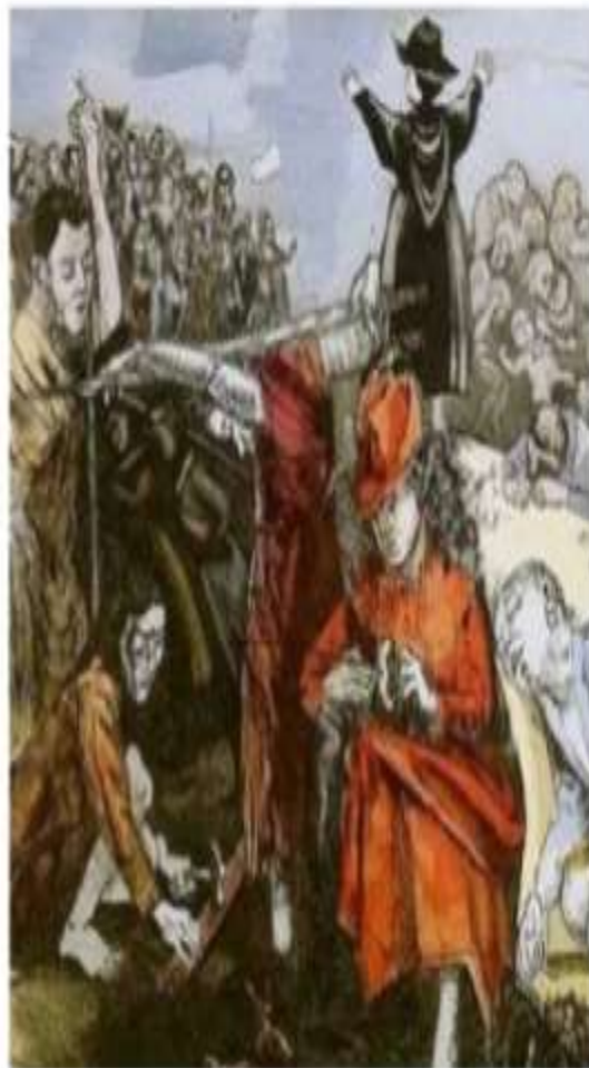
A Captura de Jerusalém durante a Primeira Cruzada, 1099, de um manuscrito medieval.